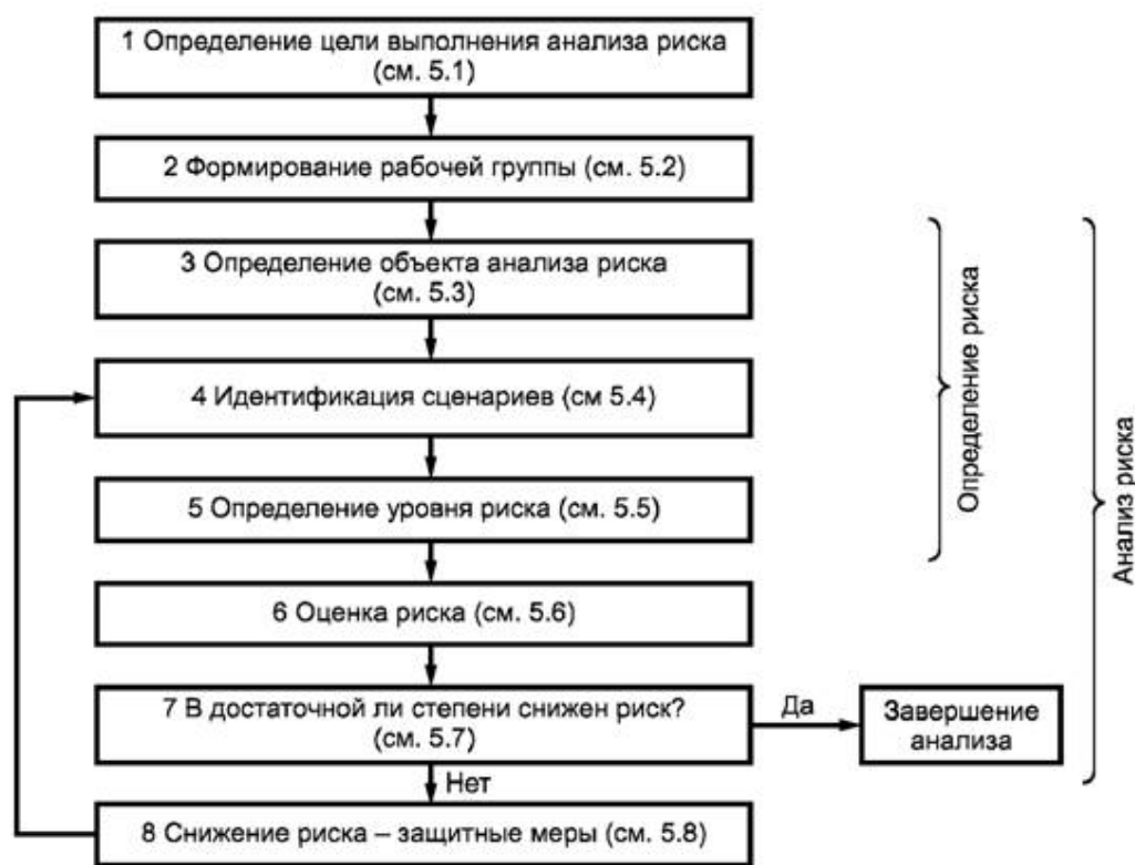
Рисунок 1. Схема выполнения анализа и снижения риска

4.2.1. Безопасность обеспечивается в процессе повторяющегося выполнения определения риска, его оценки и снижения (см. рисунок 1).