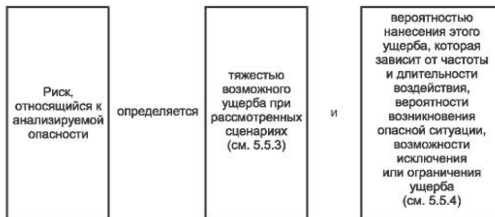
Рисунок 3. Риск и его составляющие

5.5.2.2. Составляющие риска приведены на рисунке 3.